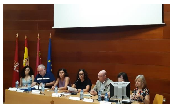
Firmado: Comité Organizador de la Mesa Redonda Crisis en la Atención Primaria. Orientación a la Comunidad desde los Equipos de Atención Primaria. Marea Blanca de la Región de Murcia.